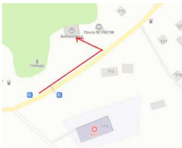
Путь к библиотеке от остановки (из с. Визинга)

Путь следования к объекту пассажирским транспортом – проезд на общественном пассажирском транспорте до остановки или такси/личный автомобиль (из с. Визинга). Расстояние от объекта до остановки общественного транспорта – 70 м. Время движения пешком – 2 минут. От остановки до объекта отсутствуют перепады высоты на пути.