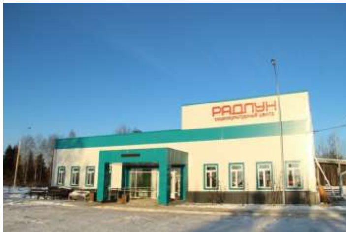
Социокультурный центр «Радлун» (Дом культуры и библиотека)

Подъезд к зданию библиотеки асфальтобетонное покрытие без перепадов.